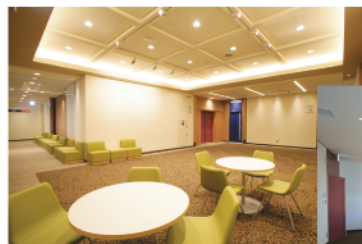
市民交流センターロビー